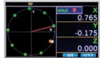
원주분할 Bolt hole circle