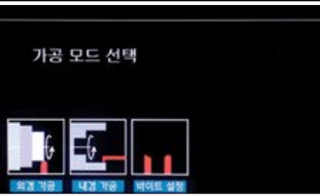
외경 R가공 Lathe, rounding edges