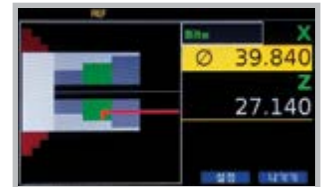
내경 단차가공 Lathe boring