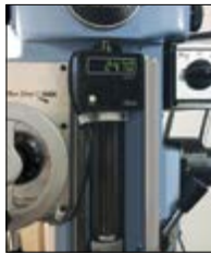
센서내장형 카운터 (밀링헤드 사용 예) Encoder built in counter