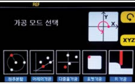
포켓가공 Pocket milling